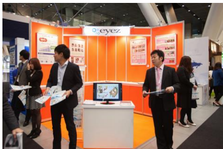
9平米ブース(3m × 3m)