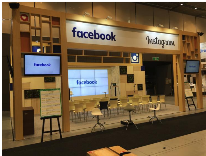
54平米ブース(9m × 6m)