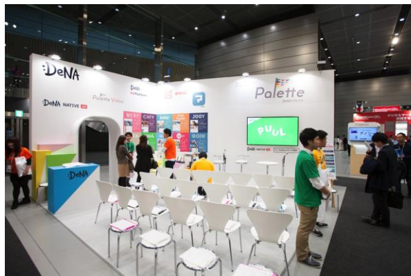
36平米ブース(6m × 6m)