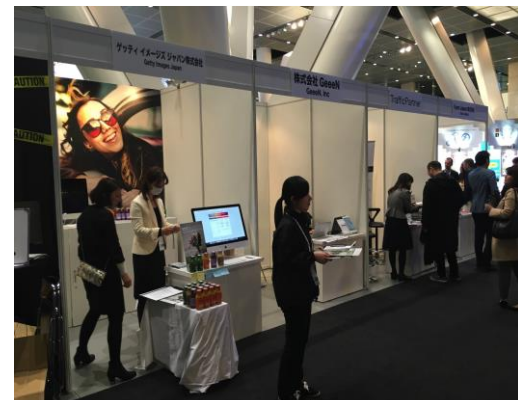
4平米ブース(2m × 2m)