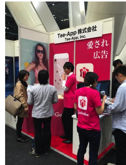
2平米ブース(2m × 1m)