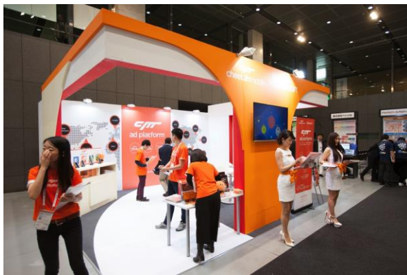
36平米ブース(6m × 6m)